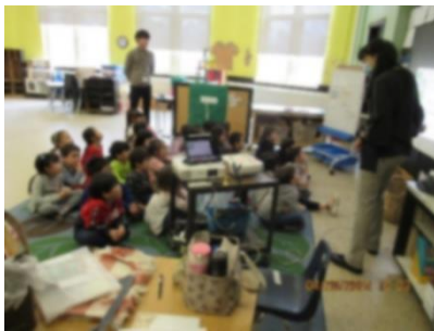
年長クラス合同で歌っています♪