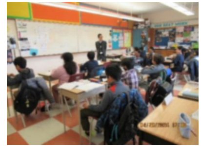
真剣に耳を傾けています(小5) 📝