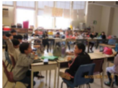
ホッと一息、うれしいお弁当 🍱